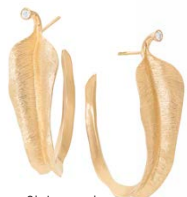
Ole Lyngaard Leaves øreringe 18 kt. guld, 24.900,- Boutique D'or