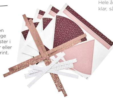
Kræmmerhus, pr. stk., 119 95 . Sjernestrimler, 129 95 Søstrene Grene

Skab din egen stil ved at bruge smukke papirrester i forskellige farver eller med finurligt print.