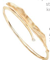
Ole Lyngaard Leaves armring 18 kt. guld, 33.900,- Boutique D'or

Skab opmærksomhed til festen med en smuk og glitrende buksedragt. Style den med høje hæle, store smykker og knaldrøde læber.