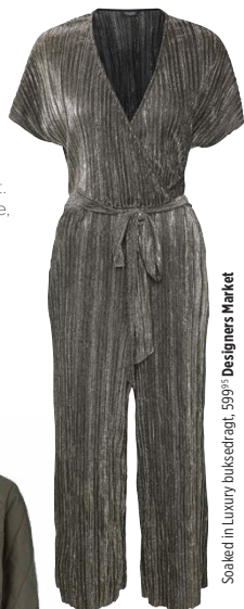
Soaked in Luxury buksedragt, 599,- Designers Market