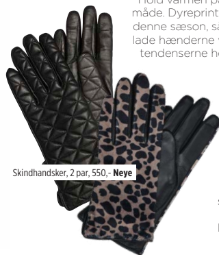
Skindhandsker, 2 par, 550,- Neye

Hold varmen på en elegant måde. Dyreprint er stadig hot denne sæson, så hvorfor ikke lade hænderne være først på tendenserne hele vinteren.