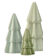
Porcelænstræ, fra 79 95 Søstrene Grene