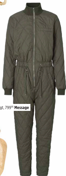
Flyverdragt, 799,- Message

Den varme termoflyverdragt er supermoderne, og chik nok til at gå an sammen med den pæne taske og de lækre læderstøvler.