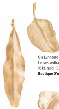
Ole Lyngaard Leaves vedhæng 18 kt. guld, 15.200,- Boutique D'or